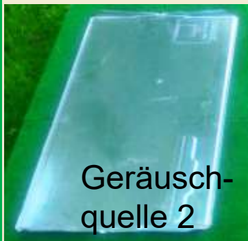
Geräusch- quelle 2