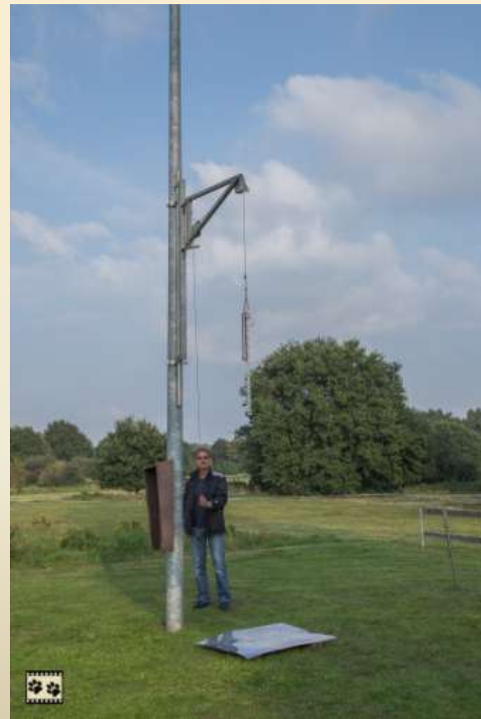
Ablauf Geräuschquelle 2